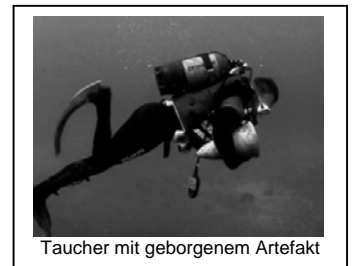
Taucher mit geborgenem Artefakt

Die ARQUEONAUTAS, gegründet 1995 auf Madeira / Portugal, betätigt sich in der kommerziellen, maritimen Archäologie und der Bergung von Artefakten aus Schiffswracks nach anerkannten wissenschaftlichen Grundsätzen. Das Unternehmen konzentriert sich hierbei nicht auf die Bergung einzelner Schiffe, sondern erwirbt Lizenzen in geographischen Gebieten, in denen eine Vielzahl werthaltiger Wracks durch historische Archivrecherchen dokumentiert werden konnten. Angesprochen werden politisch zuverlässige Regierungen, die Exklusivrechte für die Suche, Bergung und Verwertung